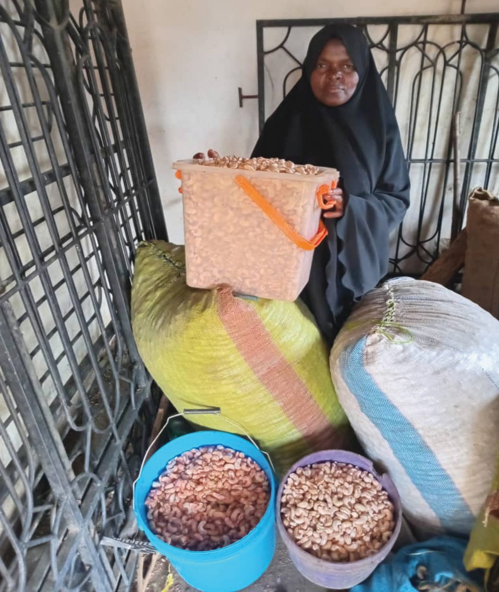
Hadija Nyalaka Mkazi wa Kijiji cha Shangani –Mchichira akiwa kwenye biashara yake ya ubanguaji korosho